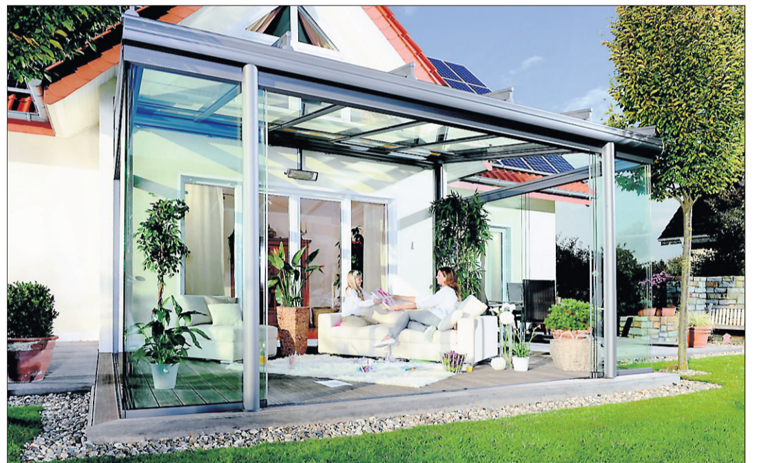
Unter einem Glasdach kann man den Terrassensommer in vollen Zügen genießen, auch falls es mal etwas kühler oder regnerisch wird.

Damit kann die Terrassensaison bereits im Frühjahr beginnen und sich bis in den Herbst hineinziehen. Zusätzliches Zubehör wie